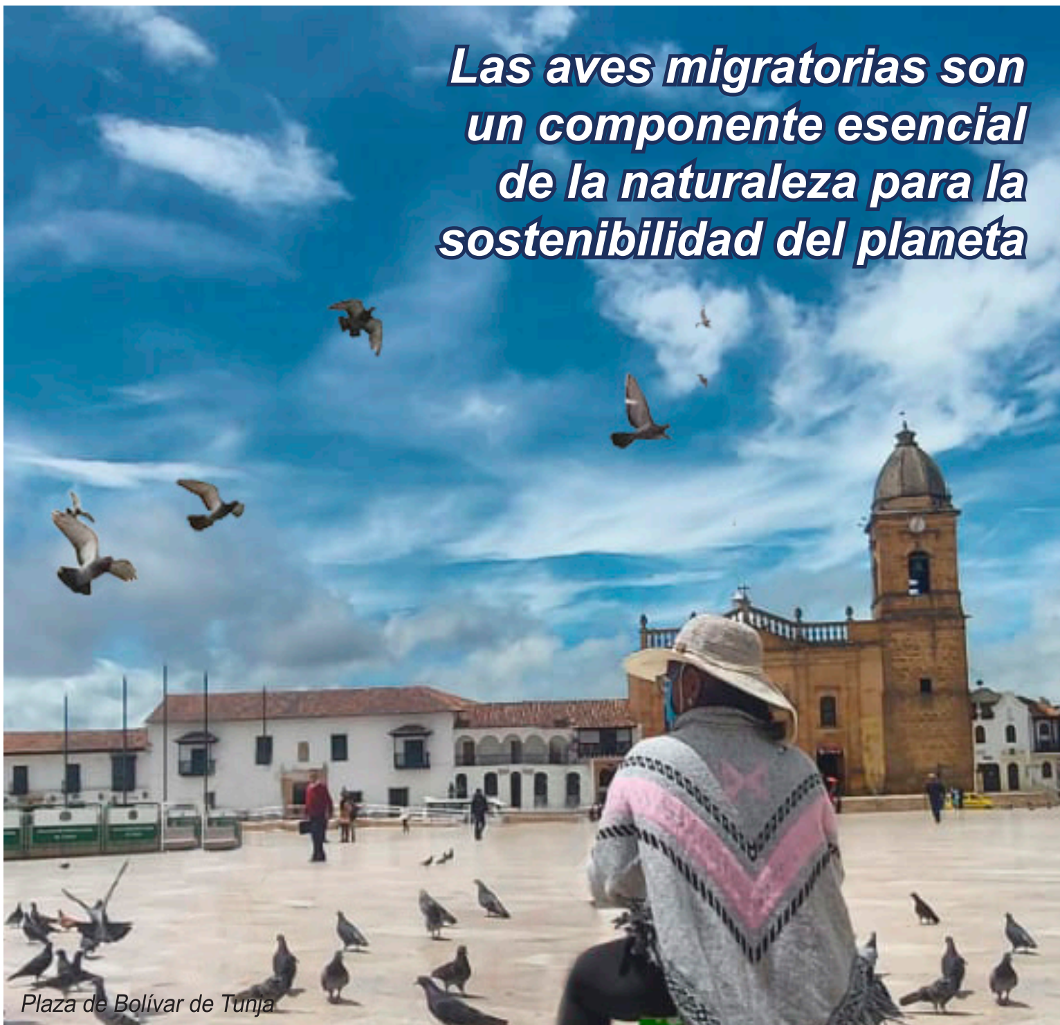
Plaza de Bolívar de Tunja